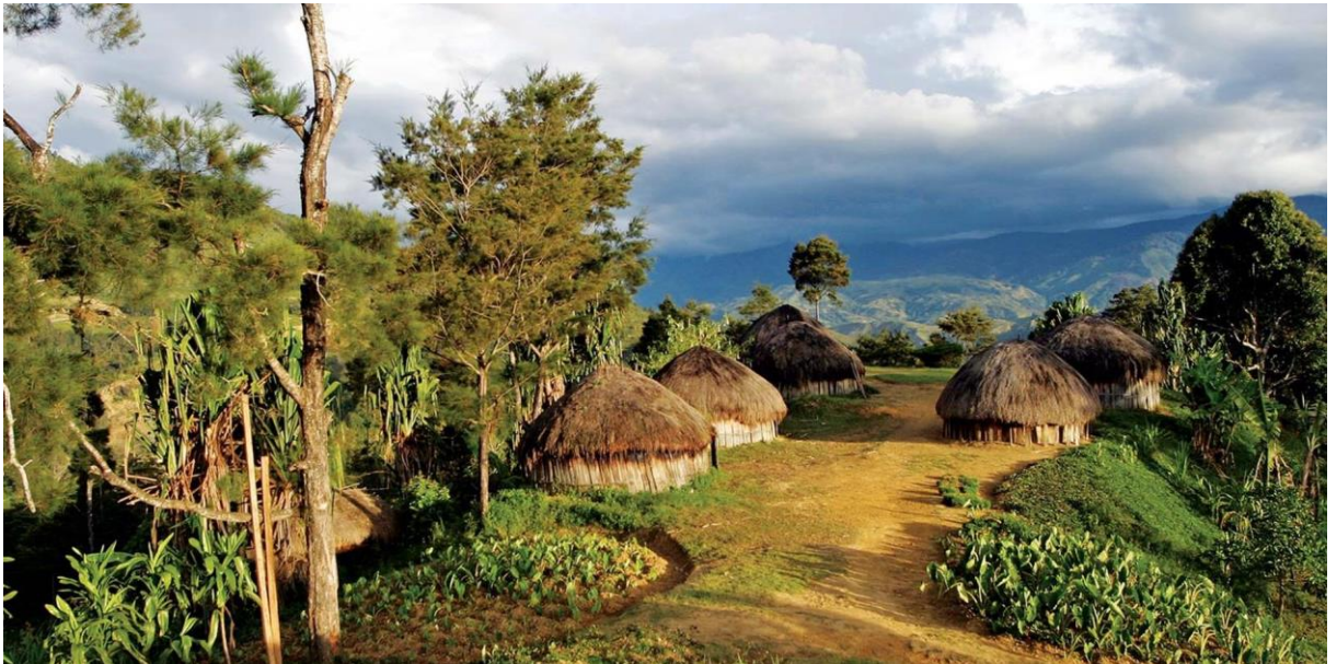
Alojamiento en el Ambua Lodge.